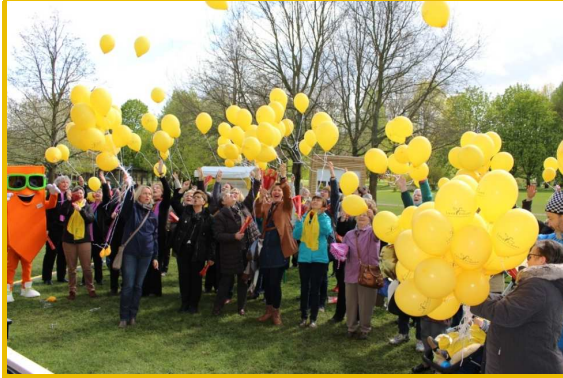
"Landfrauen: Stimmgewaltig. Mitbestimmend. Mittendrin." Großer Jubel bei der Eröffnung der Aktionstage auf der IGA Berlin 2017